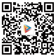
体博会官方微信公众号